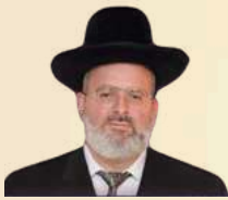
ברכת רב העיר